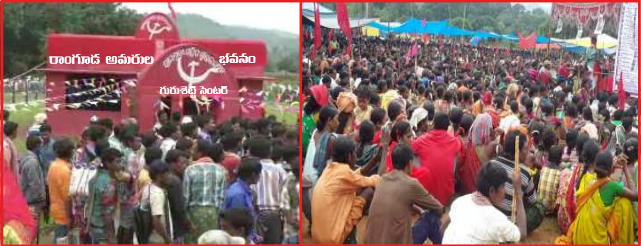
జులై 28, 2017 అమరుల వారోత్సవాల సందర్భంగా, రాంగూడ అమరుల జ్ఞాపకార్ధం, గురుశెట్టి ఛౌక్ వద్ద స్మారక భవనాన్ని నిర్మించుకోని, ఐహారంగ సభను జరుపుకున్న విప్లవ ప్రజానీకం

అమరుల వీరోచిత త్యాగాలను ఎత్తివడుతూ, వారి ఆశయ సాధనకు అంకితం అవుదాం అంటూ, గ్రామ, గ్రామాన జరిగిన అమరుల సంస్మరణ వారోత్సవాలు