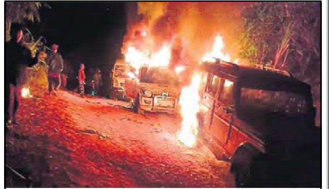
नरसंहार के खिलाफ जनता का प्रतिरोध

इसके बाद दोषी सैनिकों को कड़ी सजा देने की मांग को लेकर नगालैंड की जनता बड़े पैमाने पर आंदोलनरत हो गई. मृतकों के परिवार के सदस्यों ने जब तक न्याय