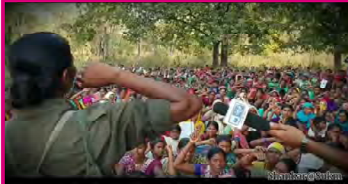
డికే-రక్షిత్ బస్టర్ జేగుర్ గొండ ఏరియాలో మార్చి 8 సభ

ఈ పోరాటాల పరంపర ఇలాగే కొనసాగుతూ 1909, నవంబర్ 22న 'అప్ రైజింగ్ ఆఫ్ టెంట్ థౌజండ్' (20వేల మంది తిరుగుబాటు) ప్రారంభమైంది. దీర్ఘకాలికమైన, కష్టతరమైన పోరాటాలను మహిళలు చేయలేరనే వాదనలను వటావంచలు చేస్తూ ఈ నమ్మె కొనసాగింది. 13 వారాల పాటు, గడ్డకట్టించే చలిలో 16 నుంచి 25 సంవత్సరాల మధ్య వయసు యువతులు ప్రతిరోజూ పికెటింగ్ చేశారు. ప్రతి రోజూ పోలీసుల లాఠీల దెబ్బలు తిన్నారు. అరెస్టులనూ, జైలు శిక్షలనూ ఎదుర్కొన్నారు.