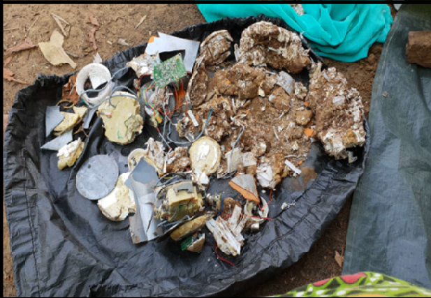
బాంబులలోని వివిధ భాగాలు,