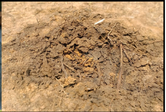
బాంబు పడిన ప్రదేశం