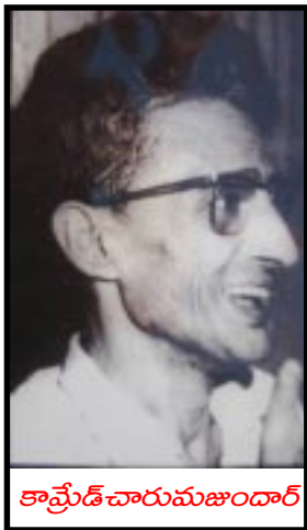
కామ్రేడ్ చారు మజుందార్